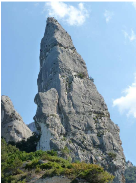
Aguglia di cala Goloritzè

Nuit tranquille sur le ferry, nous arrivons à Olbia à l'aube et prenons la route de Cala Gonone. Petit déjeuner avec vue sur la mer peu après Dorgali puis nous rejoignons la très belle cala ("calanque") Fuili pour un peu de grimpe et de baignade. Dans la soirée, nous établissons le campement à Lorotzai.