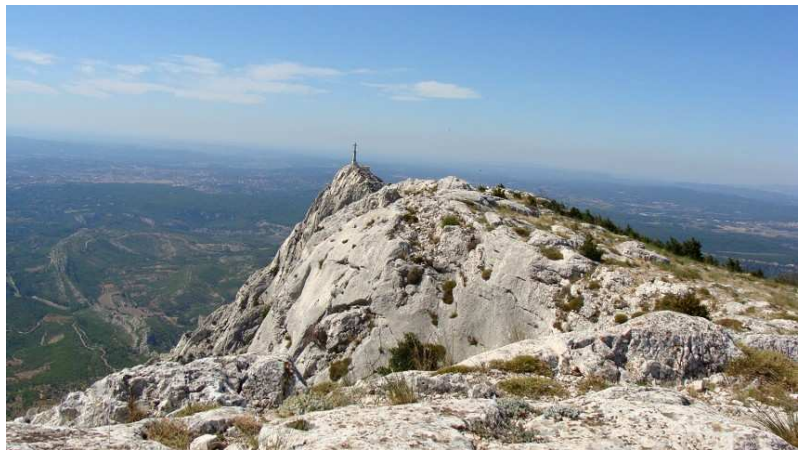
La croix de Provence

Le lendemain, nous débarquons à Toulon et retrouvons le continent sous un franc soleil. Après un petit déjeuner en bord de mer à Sanary, nous rejoignons le parking des Deux Aiguilles à la Sainte-Victoire. Pour clôturer les vacances en beauté, nous avons choisi un itinéraire classique qui nous emmène au sommet du Signal, le Grand parcours. La voie prend des allures de petite course dans