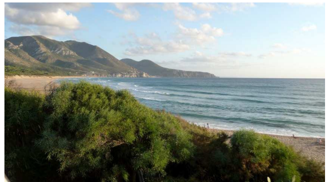
Plage de Portixeddu

Jeudi 9 septembre, nous allons poser nos mains sur le calcaire réputé d'Isili. L'escalade est à dominante athlétique et nous enchaînons les longueurs avant que le soleil ne se fasse trop brulant. En début d'après-midi, nous reprenons nos pérégrinations vers le Sud où nous visitons la capitale Sarde, Cagliari. Dans la soirée, nous rejoignons la côte occidentale de l'île près de la somptueuse plage de Portixeddu.