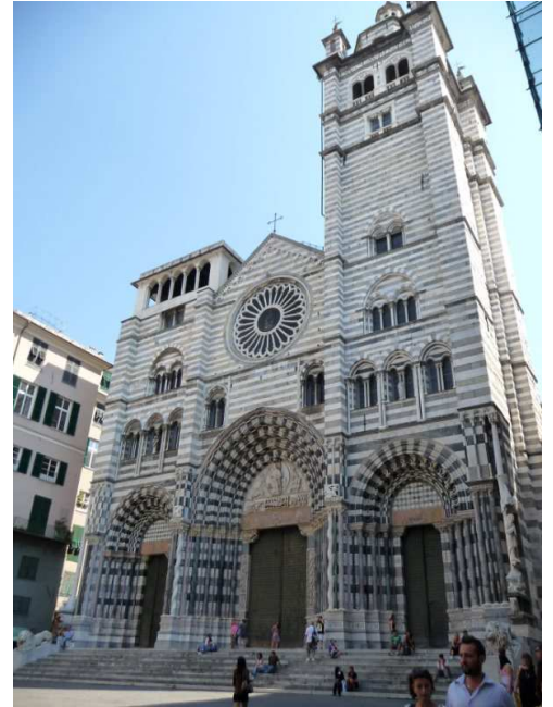
Eglise San Lorenzo - Gênes

Samedi 4 septembre, tout est chargé, nous finissons les derniers préparatifs puis nous prenons la route de Gênes. Le col du Lautaret, la vallée de la Guisane offrent toujours de jolis paysages et couleurs. Nous basculons, ensuite, en Italie via le Montgenèvre et nous arrivons dans la capitale Ligure en début d'après-midi. Le ciel est bleu et nous profitons du beau temps pour visiter et se balader dans les vicoli ("ruelles étroites") où l'enchevêtrement des étendages est typiquement italien ! Dans la soirée, nous rejoignons notre embarcadère puis notre navire. Nous appareillons à 22h pour la Sardaigne.