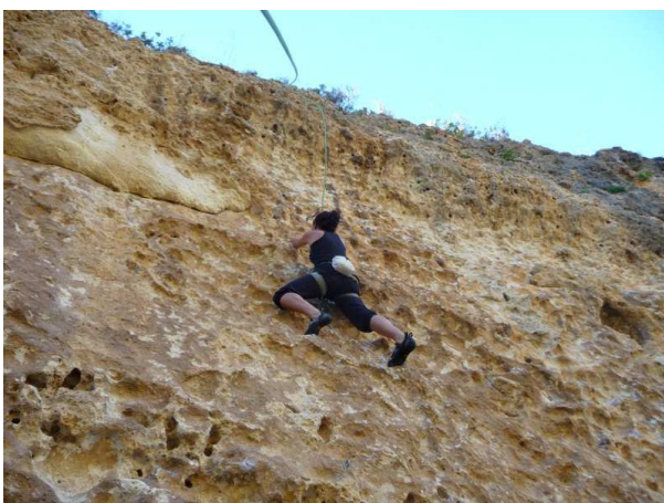
Elo à Osilo

Vendredi 10 septembre, un vent trop fort nous contraint à modifier le programme. On se replie à Masua dans les falaises bien abritées du Castello dell'Iride. Nous parcourons une voie inoubliable sur gouttes d'eau. Dans la soirée, nous entamons notre remontée vers le nord en passant par Oristano puis Bosa.