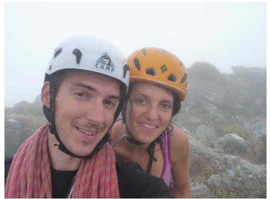
Conditions de rêve à la Giradili !

une deuxième rincée, des rafales de vent et un brouillard où l'on ne voit pas à 5m ! Petit casse-croûte, photo pour immortaliser l'instant et nous retrouvons la piste puis le camion en traversant un épais maquis. Le brouillard est toujours aussi dense et ce n'est qu'au cours de la descente vers Tortoli que nous sortons de cette purée de poix. A Arbatax, nous trouvons un joli camping en bord de mer où nous apprécions une bonne douche chaude. Séchage du matériel avant une bonne pizza et quelques bières bien méritées !